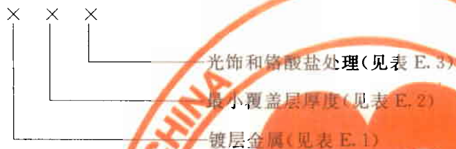
表 E.1 金属/合金镀层